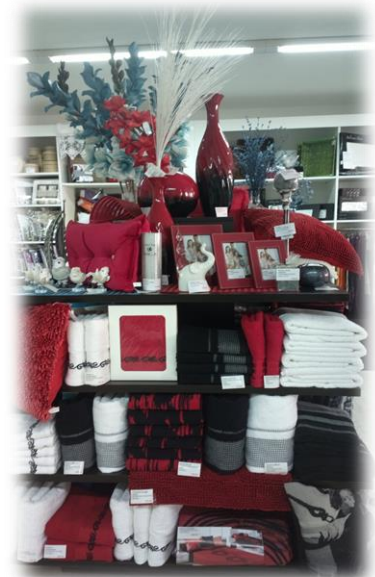
Vnitřní expozice prodejny v Litvínově

Taky se mi stalo, že jsem i já (vysokoškolák) stála před všemi těmi formuláři a ležstvy a nevěřicně do nich koukala jak do své první čítanky.