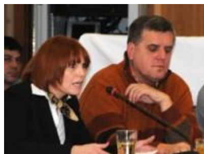
Diskuse zastupitelů města Litvínov

V roce 2010 jsem si uvědomila, že díky svým zkušenostem z podnikání, práce s lidmi a dětmi, bych je ráda využila i v práci pro město Litvínov. Proto jsem se rozhodla kandidovat v komunálních volbách jako nezávislá kandidátka za SNK ED. Po volbách na podzim roku 2010 jsem se stala zastupitelkou Litvínova a snažím se co nejlépe ovlivňovat dění ve městě Litvínov. Při své práci zastupitelky se snažím dbát na udržitelný rozvoj Litvínovska.