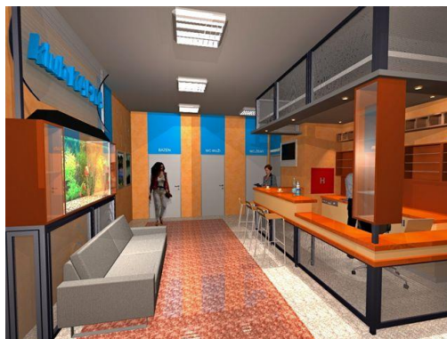
Studie rekonstrukce provozovny v Litvínově