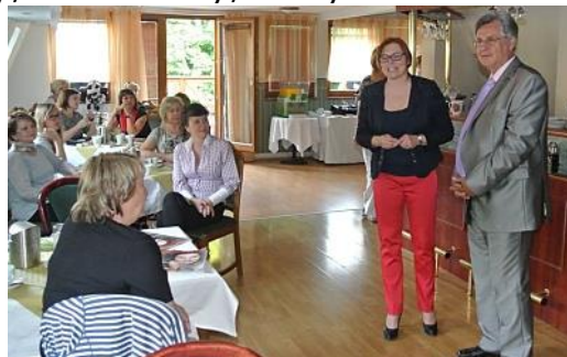
Z jednání spolku WomenNet

A jak říká můj manžel, abych se opravdu ani chvíli nenudila, založila jsem v září roku 2013 ještě spolu s dvěma kolegyněmi a kamarádkami sdružení, dnes již spolek nazvaný WomenNet. V tomto našem „dámském klubu“ jak říkáme, sdružujeme ženy podnikatelky, manažerky, ženy ve vedoucích pozicích ve veřejné i privátní sféře a ženy, které se na takové pozice připravují. Nejedná se však v žádném případě o feministické hnutí. Náš klub vznikl na základě potřeby předávat si co nejvíce informací v jeden čas, v jednu dobu a nejlépe na jednom místě. Snažíme se našim členkám co nejvíce informací předat přímo na našich zasedáních.