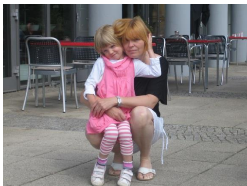
Rodina - má opora

Snažím se patřit mezi ty, které to všechno zvládají, ale bez zázemí své úžasné rodiny, skvělého manžela, dětí, fungujících babiček by to asi nešlo, nebo možná šlo, ale podstatně hůř. Proto radím všem potenciálním podnikatelkám, aby využívaly všechny možné cesty a zdroje, které jim mohou vypomoci s péčí o rodinu nebo při podnikatelské činnosti.