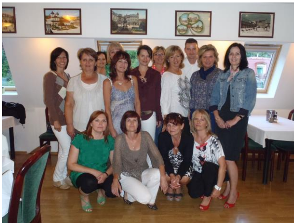
Ženský spolek WomenNet o.s.

Jedná se o poradenskou a vzdělávací organizaci, která se v širokém spektru svých činností zaměřuje především na práci s ženami. Základním cílem spolku WomenNet je podpořit a motivovat všechny ženy k aktivnímu řešení jejich leckdy složité životní situace, k jejich většímu zviditelnění ale i ocenění jejich dlouholeté práce a vytvoření širokého regionálního networkingu.